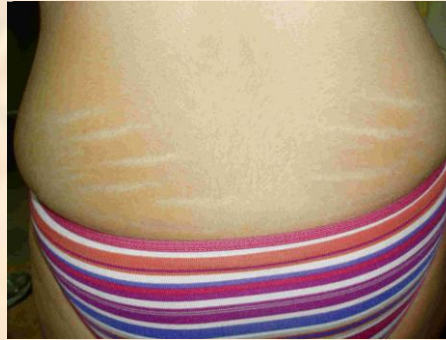
Estrias región lumbar Lumbar region Striae