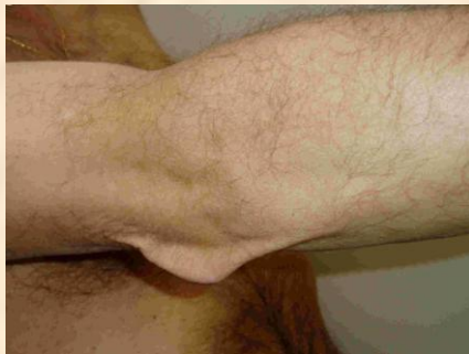
Piel laxa Lax skin