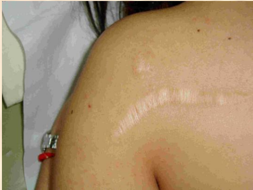
Cicatriz papirácea Papiraceous Scar