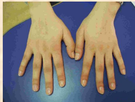
Piel oscura en dedos Dark skin on the fingers