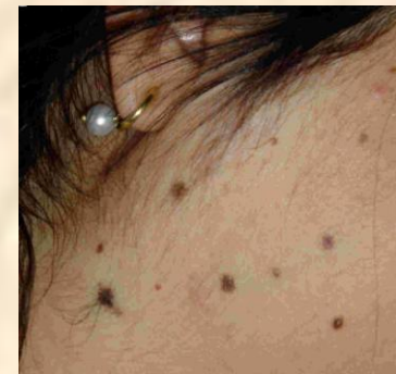
Lunares lenticulares Lenticular moles